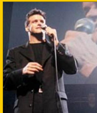
Roch Voisine a bénéficié de l'appui de ses fans.

On comprend pourquoi elles lui ont refait la fête lors de son come back de l'automne dernier.